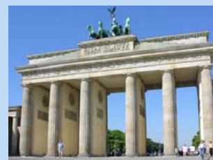
Berlin ca. 60km