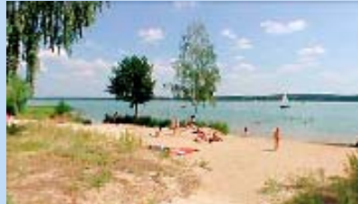
Strand am Scharmützelsee ca. 150m