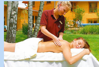
SATAMA Saunapark ca. 150m