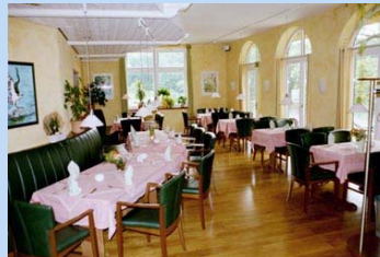
Gourmet Restaurant „Fischhaus“ ca. 2km