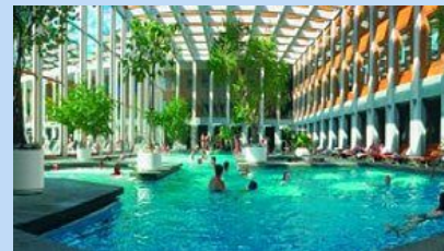
Bad Saarow Therme ca. 12km